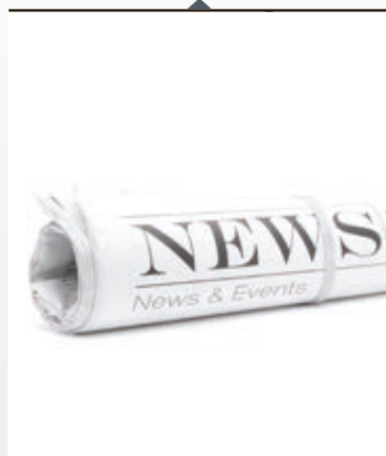
Notizie in tempo reale