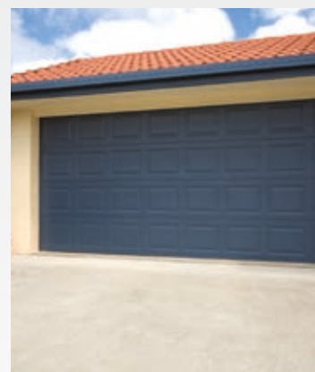
Controllo varchi e tapparelle